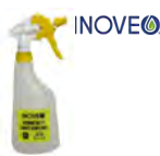
Pulvérisateur vide sérigraphie surfaces & vitres