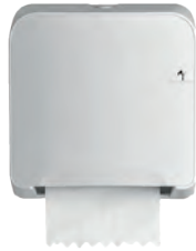
Distributeur autocut midi essuie-mains rouleaux