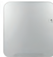
Distributeur papier toilette maxi jumbo