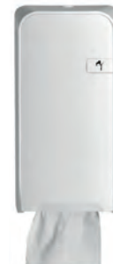
Distributeur papier toilette plié