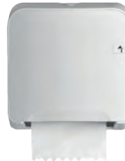
Distributeur autocut mini essuie-mains rouleaux