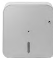
Distributeur PH DC mini jumbo