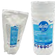
Lingette désinfectante surfaces DASR