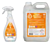
Détergent multi-surfaces & graisse cuite ECO