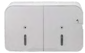
Distributeur papier toilette dévidage central double rouleaux