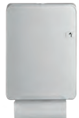
Distributeur essuie-mains plié