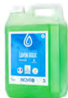
Savon corporel lotion doux