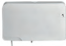
Distributeur papier toilette mini jumbo double